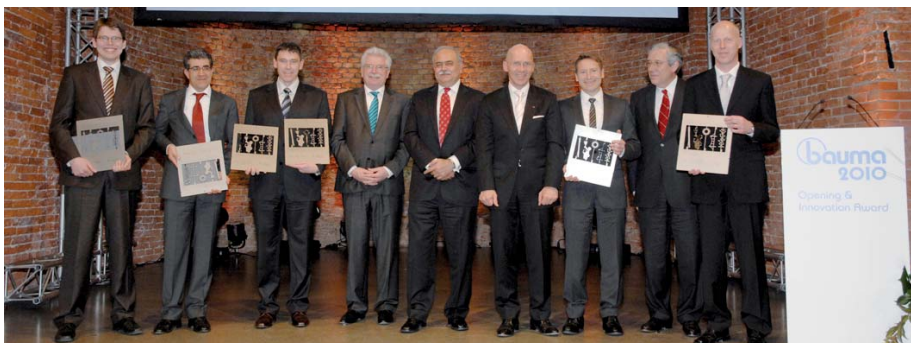
Verdiente Preise für großartige Lösungen: Die Preisträger des bauma-Innovationspreises 2010.