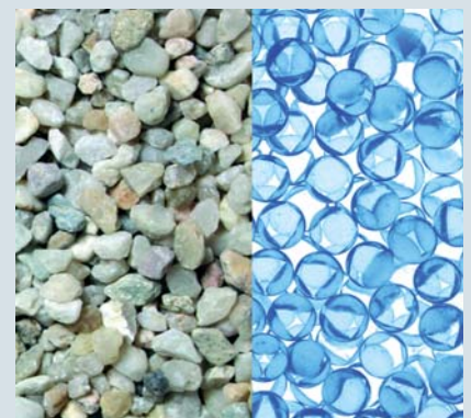
Ochs setzt im Brunnenbau statt Kies oder Splitt (li.) Kugeln aus Glas (re.) ein, die einen größtmöglichen freien Porenraum garantieren.

Glaskugeln haben gegenüber Sand und Kies eine vier bis zehnmal höhere Festigkeit, dazu eine optimale Kugelform bei nahezu gleicher Korngröße. So entsteht ein größtmöglicher freier Porenraum, durch den das Wasser ungehindert fließen kann. Ablagerungen wie Kalk, Eisen oder Mangan können sich weitaus schwerer im Ringraum bilden, weniger Reinigungsintervalle sind nötig. Das sichert eine höhere Wirtschaftlichkeit und Langlebigkeit des Brunnens.