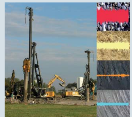
Gutes Gehör: Der Geoscanner nutzt das Körperschallverhalten. Das kommt der exakten Baugrunduntersuchung bei komplexen Tiefbaumaßnahmen stark entgegen.

Der am Lehrstuhl für Tagebau und internationaler Bergbau der TU Clausthal entwickelte Geoscanner ist ein neues akustisches Scan-Verfahren für die effektive und professionelle Baugrund- und Lagerstättenerkundung sowie zur Bestimmung von Lockergestein. Das Prinzip ist einfach: Verschiedene Materialien haben unterschiedliches Körperschallverhalten. Körperschallschwingungen bilden einen typischen Fingerabdruck in der Gebirgsformation, die mit dem neuen Geoscanner sichtbar werden. Das ersetzt die herkömmliche visuelle Materialbeurteilung. Eine trennflächenscharfe Erkennung ist möglich, was neben der Rohstoffgewinnung auch der Baugrunderkundung bei Spezialtiefbauvorhaben zugutekommt.