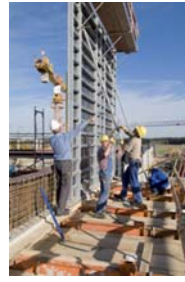
Ein Beispiel aus der Praxis: Aufstellen des Schalelementes mit einem Kran.

bequem in elektronischer Form verfügbar sind, – Dokumentation von bestätigten Schulungen und Maschineneinweisungen der Mitarbeiter sowie gegebenenfalls des weiteren Baustellenpersonals.