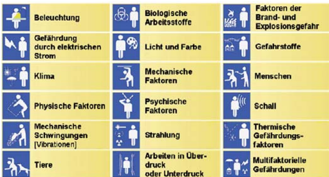
Symbolische Darstellung der unterschiedlichen Gefährdungsfaktoren, wie sie in der Praxis auftreten können.