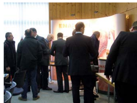
Um mehr Details zu erfahren, belagerten die Teilnehmer in den Vortragspausen auch die Stände der Akteure. Letztere nahmen aus den Gesprächen wichtige Impulse mit zurück in ihre Unternehmen.