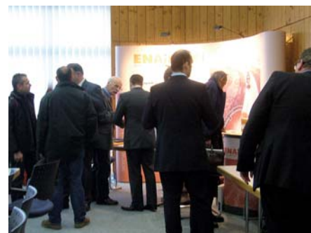
Um mehr Details zu erfahren, belagerten die Teilnehmer in den Vortragspausen auch die Stände der Akteure. Letztere nahmen aus den Gesprächen wichtige Impulse mit zurück in ihre Unternehmen.