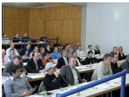
Ein X für ein U vormachen? Das kommt bei den Praktikern und Nutzern der Systeme nicht in die Tüte. Sie wollen genau wissen, was Sie in Zukunft bei der Telematik in Baumaschinen erwartet.