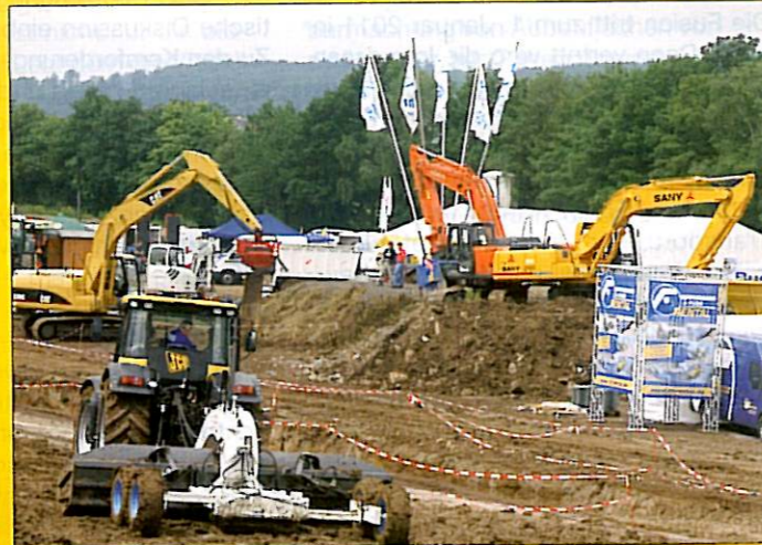
Attraktive, großzügige Standflächen für Open-Air-Vorführungen am neuen Standort Airpark Baden-Baden kommen dem Demonstrationscharakter der TiefbauLive stark entgegen.